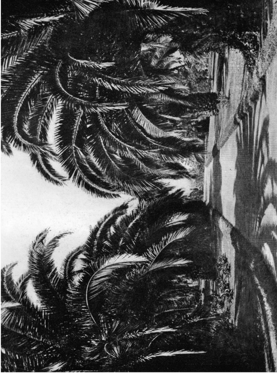
PALMEN-ALLEE AM INTERNATIONALEN THEOSOPHISCHEN HAUPTQUARTIER, POINT LOMA