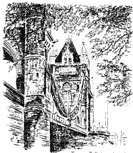
Tower Brücke · London