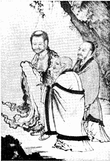
Buddha, Konfuzius und Laotse

und kulturellen Überlieferung. Eine Nation ist immer nur so stark wie ihre Lebensphilosophie. Daher ist es gewiß von Interesse, sich die drei Hauptquellen der religiösen Inspiration zu vergegenwärtigen, die China in jenen Jahrhunderten der Größe beeinflussten, und darüber zu sprechen.