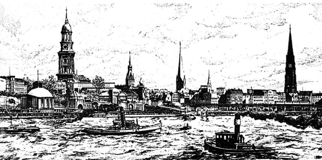
HAMBURG, BLICK VOM HAFEN AUF DIE TÜRME DER STADT