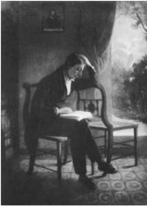
John Keats (1795-1821) Aus einem posthumen Portrait von Joseph Severn

Ich erinnere mich, wie du sagtest, dass du Ahnungen von einem guten Genius hättest, der dich überwacht. Ich hatte unlängst denselben Gedanken – denn Dingen, die [ich] tue, wird halb zufällig später, so wie ich es sehe, dutzendfach Recht gegeben. Ist es zu gewagt, sich Shakespeare als diesen Vorsitzenden vorzustellen?