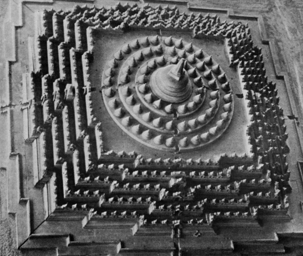
Aus Louis Frédéric, Temples

fortschreitenden Erfahrungs- und Bewußtseinsstufen des Menschen veranschaulichen. Weil diese Paneele – im ganzen 1460 – sehr realistisch sind, identifiziert sich der Pilger mit ihnen, und je höher er geht, desto weiter und tiefer wird seine Perspektive. Der unterste Teil oder die unterste Terrasse stellt mit 160 ausgemeißelten Szenen die Bewußtseinsebene des täglichen Lebens dar. Die Paneele auf den folgenden viereckigen Terrassen und Galerien stellen die vierfache Natur unserer objektiven Wahrnehmungen dar, während die drei höheren, kreisförmigen Reihen, weil sie keine Abbildungen haben, auf die Stufen unseres zunehmenden geistigen Bewußtseins hindeuten.